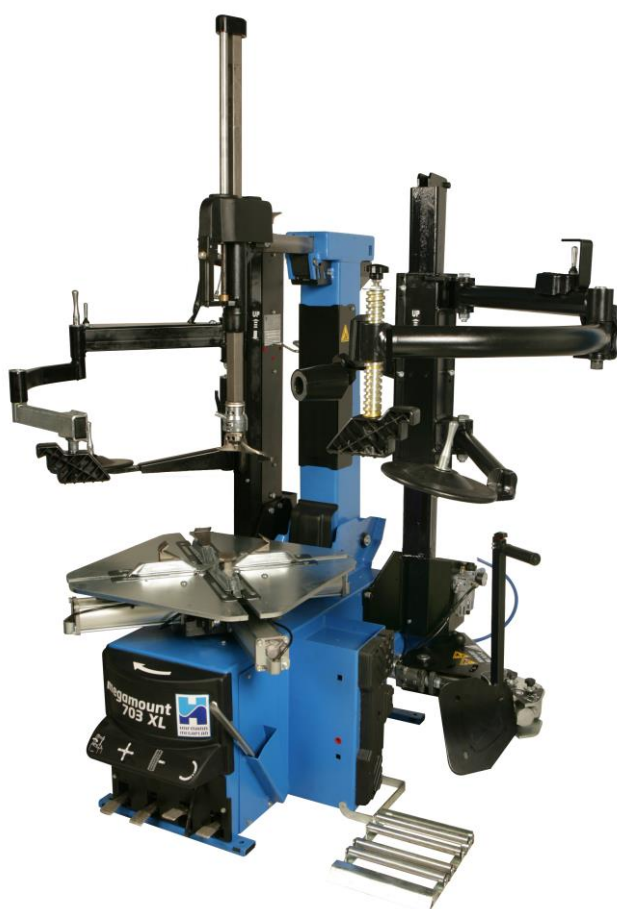
megamount 703XLE Racing

Montażownica Megamount 703 RACING przeznaczona jest do obsługi nawet najbardziej złożonych kół. Zawiera ona zestaw opatentowanych głowic szybkoocucujących (standardową metalową, z tworzywa sztucznego oraz do obsługi wypukłych szprych), ogranicznik ruchu lemiesza, zabezpieczający obręcz przed uszkodzeniem oraz zbijak podwójnego działania, którego ramię może być ustawione w pozycji wyjściowej po zwolnieniu przycisku.