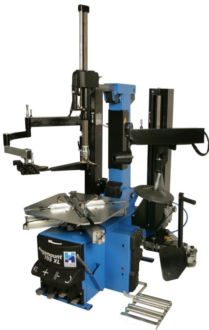
megamount 703XL Racing