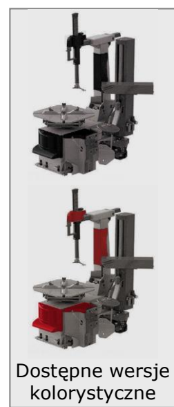
Dostępne wersje kolorystyczne