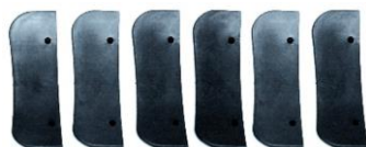
Nakładki na lemiesz zbijaka