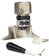
Głowica montażowa szybkomocująca do felg szprychowych Konvex (np. VW T5, Touareg)