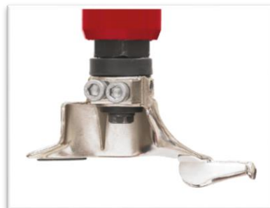
tradycyjna głowica montażowa stalowa z zestawem ochronnym