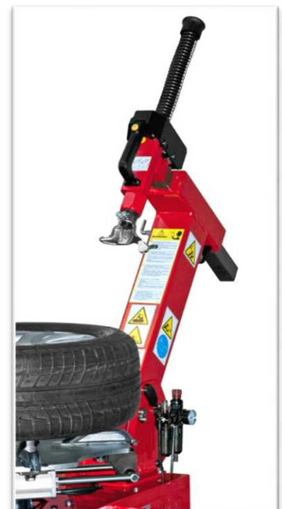
kolumna odsuwana do tyłu sterowana pneumatycznie