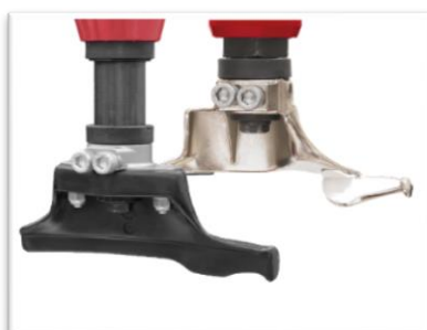
tradycyjna głowica montażowa - plastikowa lub - stalowa (z zestawem ochronnym)