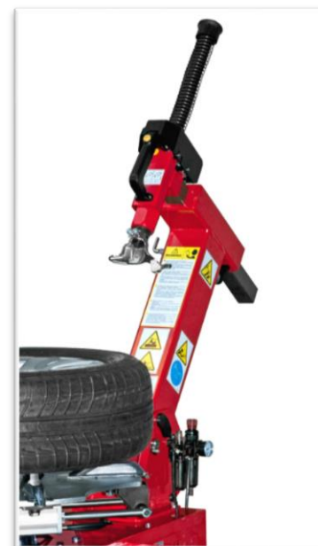
kolumna odsuwana do tyłu sterowana pneumatycznie