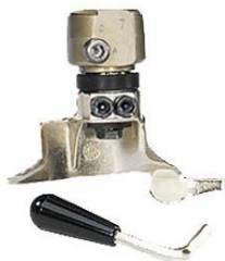
Głowica montażowa szybkomocująca do felg szprychowych Konvex (np. VW T5, Touareg)