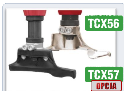
tradycyjna głowica montażowa - plastikowa lub - stalowa (z zestawem ochronnym)