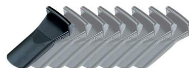
nakładka na szczęki mocujące koło