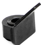
Nakładka na głowicę montażową do felg szprychowych Konvex