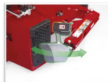
PowerOut™ zbiak o dużej sile i prędkości sterowany precyzyjnie ręcznie