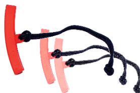
Nakładka montażowa (ochronna) na felgę