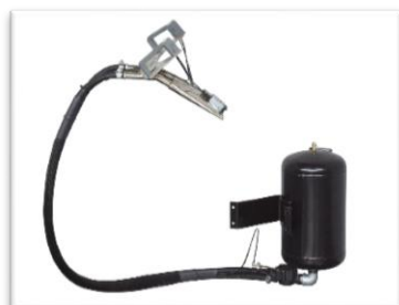
zestaw do inflacji powietrza