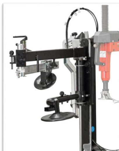
BPS (Bead Press System) prawa strona ramię systemowe (premium) wspomagające montaż opon niskoprofilowych oraz typu run-flat