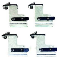
Nakładki na szczęki do kół motocyklowych