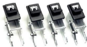
Nakładki na szczęki do kół motocyklowych Harley-Davidson