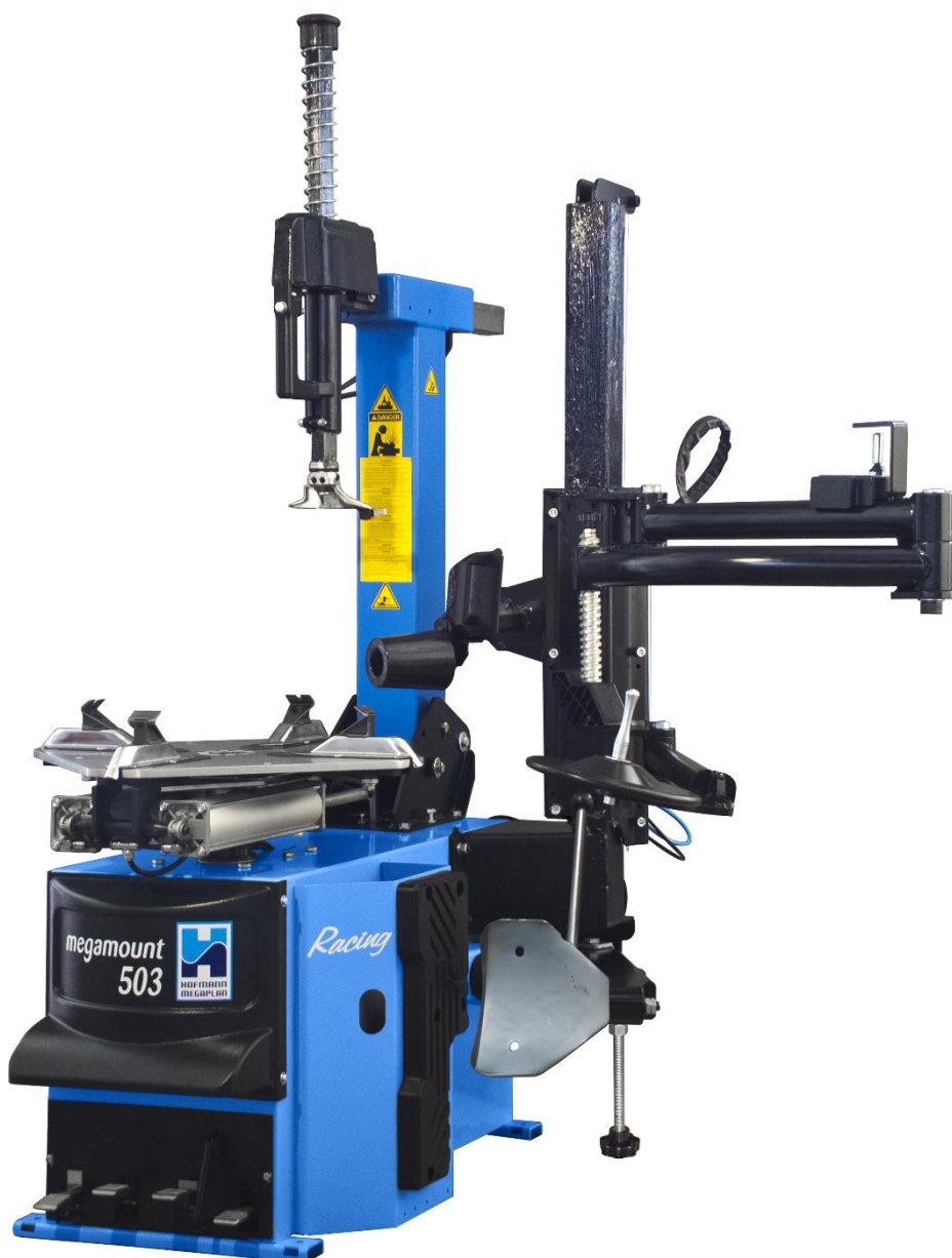
megamount 503 Racing