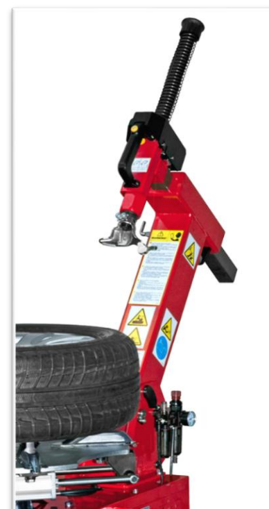
kolumna odsuwana do tyłu sterowana pneumatycznie