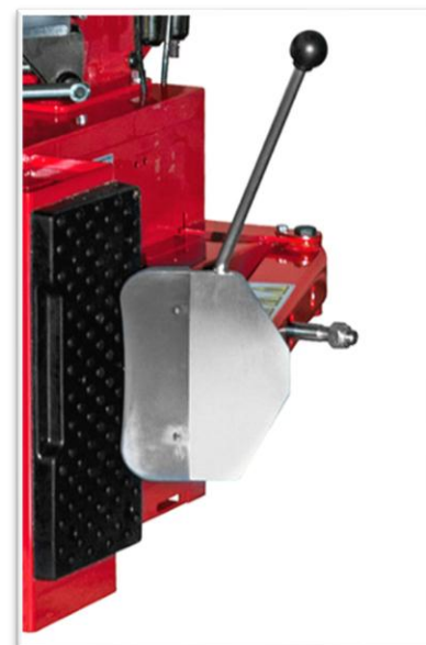
zbijak o dużej sile i prędkości sterowany pedałem